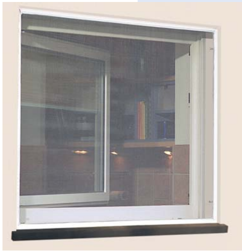
Rahmen mit Federstiften in der Außennische montiert.